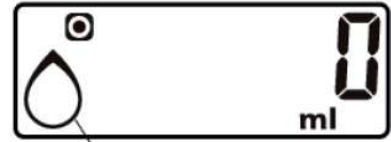
POMIAR OBJĘTOŚCI WODY